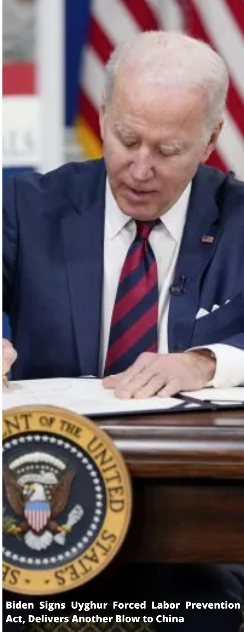
Biden Signs Uyghur Forced Labor Prevention Act, Delivers Another Blow to China