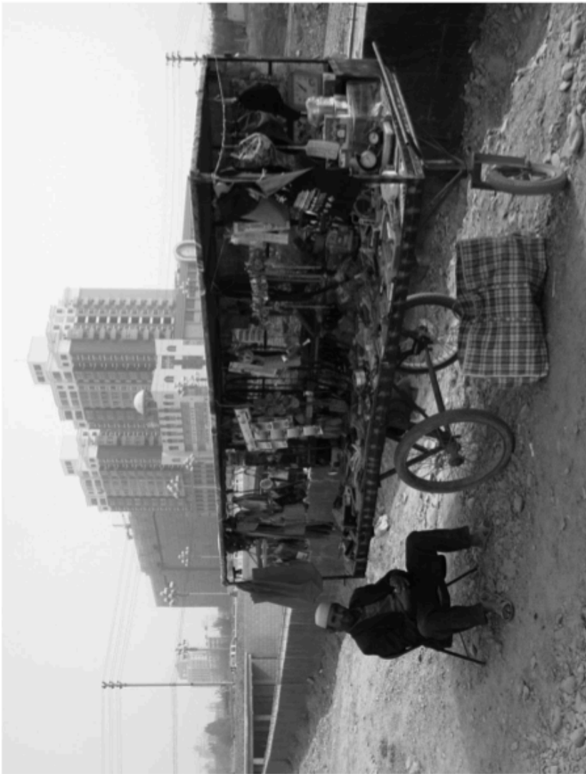
4 A Uyghur man sells 'knick-knacks' in front of a newly built apartment complex, Korla 2007.

بىر ئۇيغۇر ئەر يېڭى پۈتكەن ئولتۇراق رايونىنىڭ ئالدىدا ئۇششاق - چۈششەك تۇرمۇش بۇيۇملىرىنى ساتماقتا، 2007 - يىلى كورلا. (ئەسەرنىڭ ئەسلى نۇسخىدا مۇشۇ بابنىڭ ئارقىقىغا قىستۇرۇلغان رەسىم)