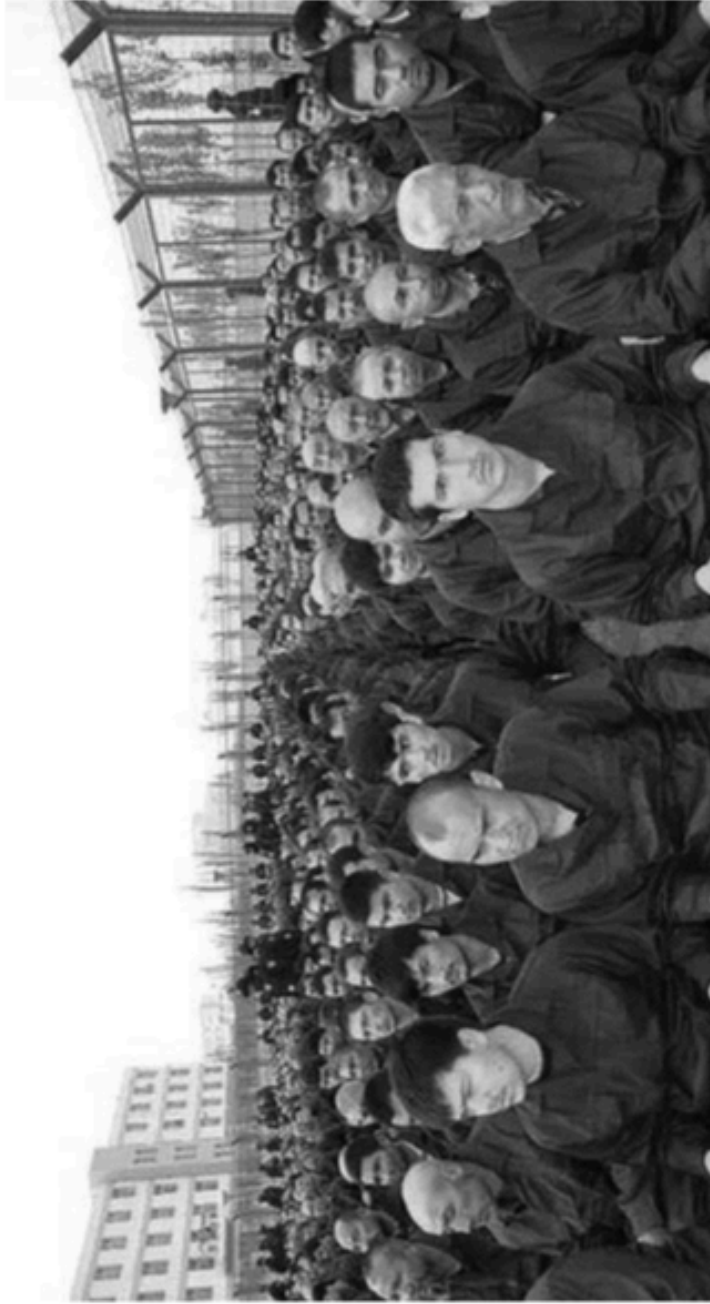
6 Uyghur men sit at attention in a mass internment camp in Lop near Khotan, 2017.

ئۇيغۇر ئەرلىرى خوتەن ۋىلايىتىنىڭ لوپ ناھىيەسىدىكى بىر جازا لاگېرىدا تىك ئولتۇرماقتا، 2017 - يىلى. (ئەسەرنىڭ ئەسلى نۇسخىسىغا قىستۇرۇلغان رەسىم)