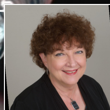
ياخشى رەھبەر ئىستراتېگىيىسى